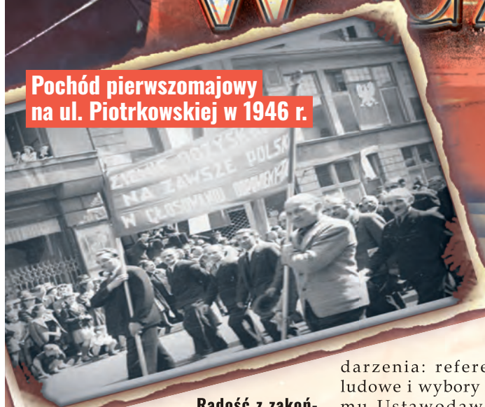
Pochód pierwszomajowy na ul. Piotrkowskiej w 1946 r.