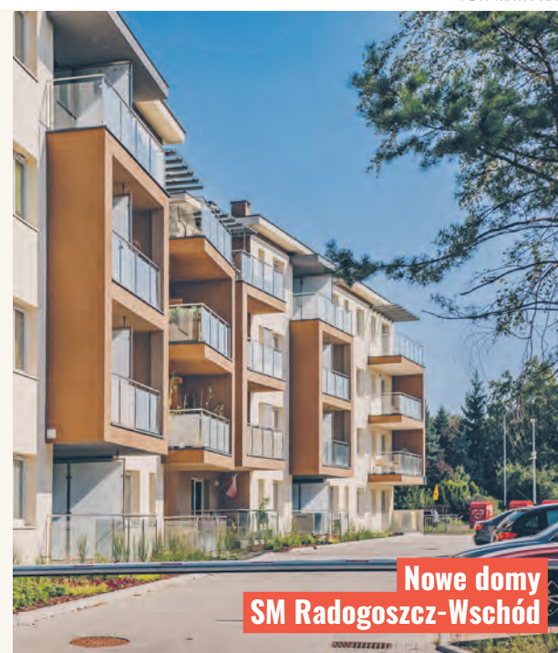
Nowe domy SM Radogoszcz-Wschód