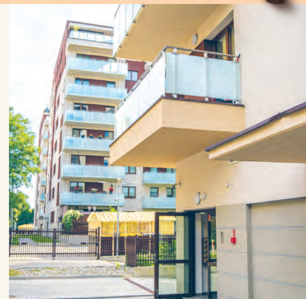
Nowy blok SMB „Kielnia”