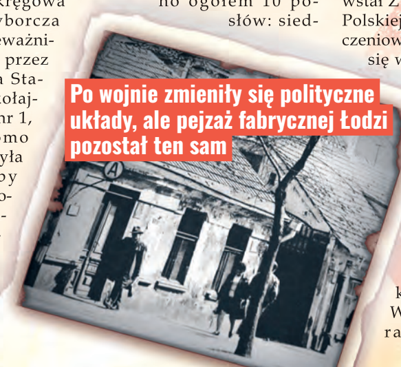
Po wojnie zmieniły się polityczne układy, ale pejzaż fabrycznej Łodzi pozostał ten sam

W momencie powstania PZPR była partią masową, w całej Polsce liczyła 1,3 mln członków. Realizując wytyczne władz centralnych, łódzka organizacja aktywnie włączała się w liczne akcje polityczne. Zarówno wybory do sejmu, jak i do rad narodowych były dla PZPR głównymi wydarzeniami politycznymi, choć tak naprawdę miały wyłącznie charakter formalny, gdyż wystawiano tylko jedną listę. Szczególną wagę miały dla komunistów konferencje i zjazdy partyjne, które stały się niemal teatralną manifestacją „ideologicznej jedności społeczeństwa z linią partii”. I tak się zaczęło życie w PRL-u.