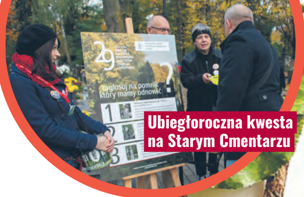
Ubiegłoroczna kwesta na Starym Cmentarzu

Przygotowana została także specjalna oferta dla szkół. W każdą środę 10 października i listopada w godz. 10:00-14:00 będzie można wziąć udział w bezpłatnym spacerze z przewodnikiem po Starym Cmentarzu przy ul. Ogrodowej. Pytania oraz zgłoszenia grup należy kierować na adres e-mail: tonsc1999@gmail.com. Od lat w działania na rzecz popularyzacji wartości historycznych i zabytkowych Starego Cmentarza włącza się też Muzeum Miasta Łodzi. Z okazji 30. kwesty placówka zaprasza w listopadzie na specjalną lekcję muzealną „Stary Cmentarz. Miasto – Ludzie – Historie”. Jest ona dedykowana starszym klasom szkoły podstawowej oraz szkołom ponadpodstawowym. Zwiedzanie wybranych wystaw Muzeum Miasta Łodzi zostanie uzupełnione o spacer plenerowy po zabytkowej łódzkiej nekropolii, a specjalnie przygotowane karty edukacyjne pozwolą uczniom na aktywne uczestnictwo w poznawaniu wielokulturowej historii naszego miasta. Trasa spaceru będzie prowadzić przez wszystkie części Starego Cmentarza. Zainteresowani nauczyciele