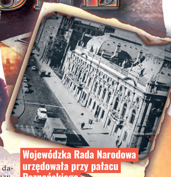
Wojewódzka Rada Narodowa urzędowała przy pałacu Poznańskiego

Radość z zakończenia okupacji prawdopodobnie uśpiła społeczną czujność wobec dokonujących się po wojnie przemian, których głównym motorem były konsekwentnie prowadzone przez nowy aparat władzy działania polityczne i propagandowe zapożyczane z Kraju Rad.