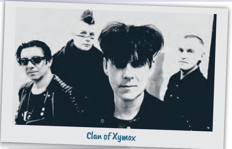
Clan of Xymox