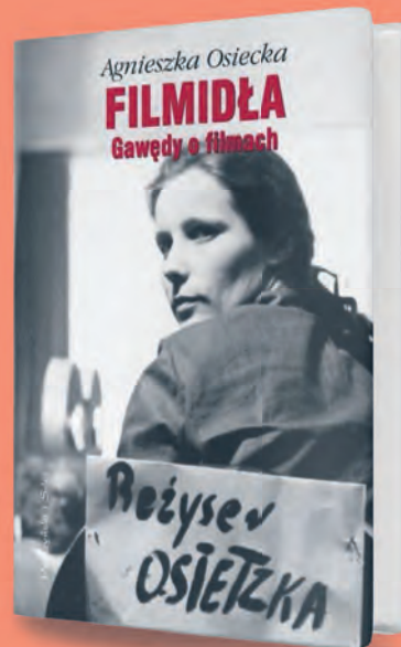
Agnieszka Osiecka z czasów studiów w Szkole Filmowej w Łodzi na okładce książki poświęconej jej przygodzie z kinem