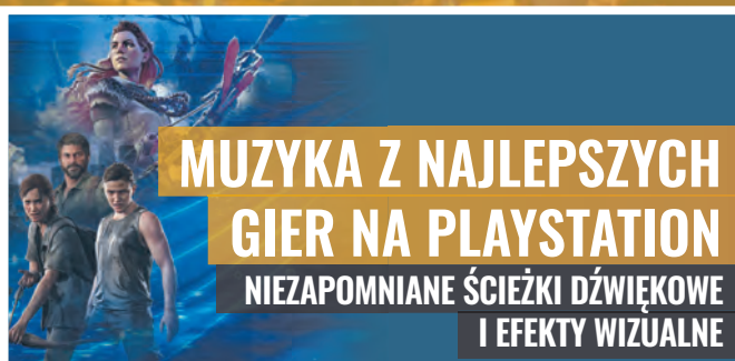
MUZYKA Z NAJLEPSZYCH GIER NA PLAYSTATION