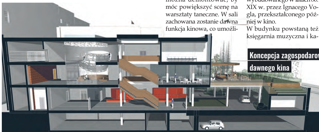
Koncepcja zagospodarowania dawnego kina