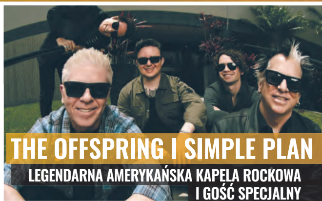
THE OFFSPRING I SIMPLE PLAN