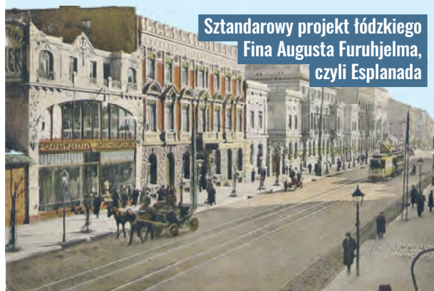
Sztandarowy projekt łódzkiego Fina Augusta Furuholma, czyli Esplanada

Od 1912 r. August Furuholm prowadził prywatną praktykę architektoniczną i miał biuro przy ul. Wileńskiej 83 (ul. Kilińskiego). Był członkiem Resursy Rzemieślniczej Chrześcijańskiej w Łodzi, działał też w Stowarzyszeniu Właścicieli Nieruchomości, inicjując np. organizację tanich kuchni i herbaciarni w czasie I wojny światowej. Później prawdopodobnie wrócił do Warszawy. Zmarł 13 marca 1962 r. w Olsztynie. agr