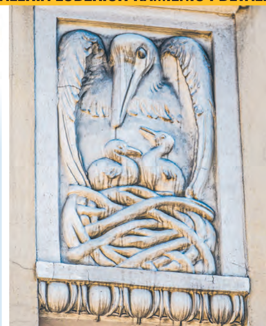
Detal architektoniczny zabytkowej kamienicy przy ul. Piramowicza 6