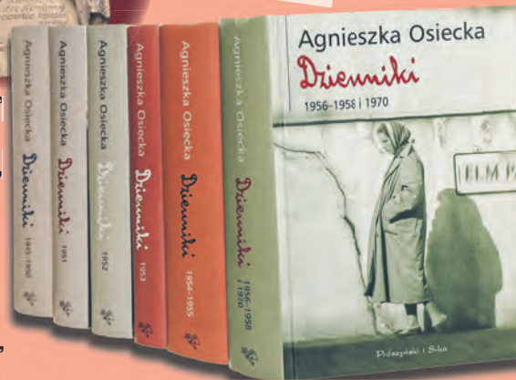
Wielotomowy zbiór „Dzienników” A. Osieckiej