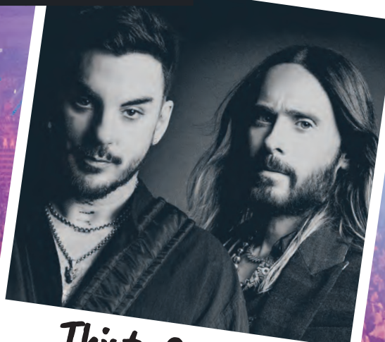
Thirty Seconds To Mars

KONCERTOWY KALENDARZ ATLAS ARENY NA 2025 R. strona 3