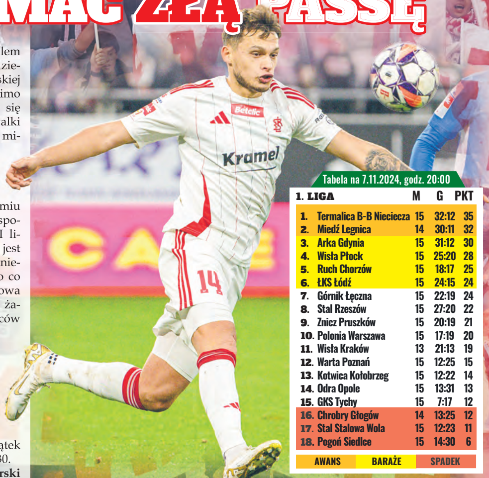
Tabela na 7.11.2024, godz. 20:00