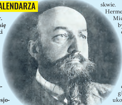
Tadeusz Miciński, jeden z intrygujących młodopolskich guru, urodzony w Łodzi