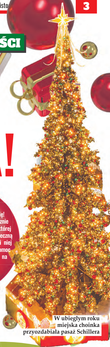
W ubiegłym roku miejska choinka przyozdabiała pasaż Schillera

Chcesz zostać prawdziwym Świętym Mikołajem? Dobrym sercem tworzy się największą magię! Fundacja Słonie Na Balkonie rozpocznie niebawem charytatywną aukcję, której zwycięzca osobiście uruchomi świąteczną iluminację w Łodzi. Uzbierane dzięki niej fundusze zostaną przekazane na pomoc dzieciom po traumie. Szczegóły na stronie: www.lcw.lodz.pl