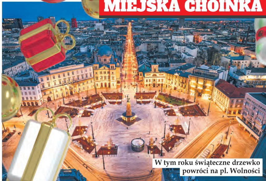
W tym roku świąteczne drzewko powróci na pl. Wolności