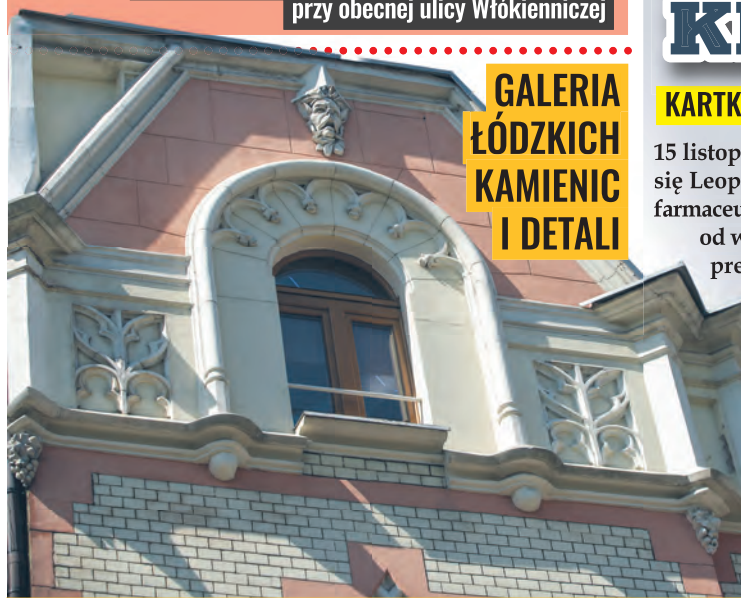
Zwieńczenie zabytkowej kamienicy przy ul. Piramowicza 11 z 1900 r.