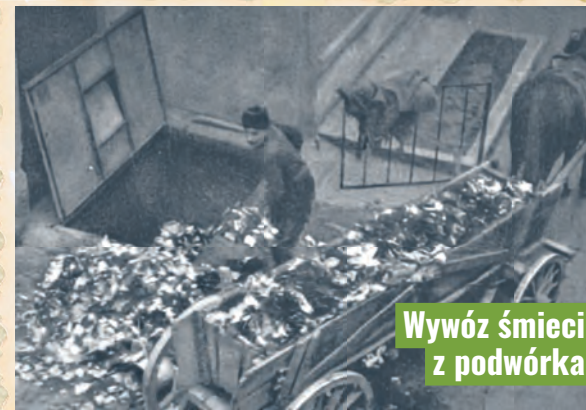
Wywóz śmieci z podwórka

ści biologicznych urąga najprymitywniejszym wymogom przepisów sanitarnych. Beczkowozy są drewniane i niehermetycznie zamknięte. Gdy jadą po wyboistych ulicach nieczystości wylewają się z beczek na ulicę”. Warunki sanitarne w Łodzi poprawiły się