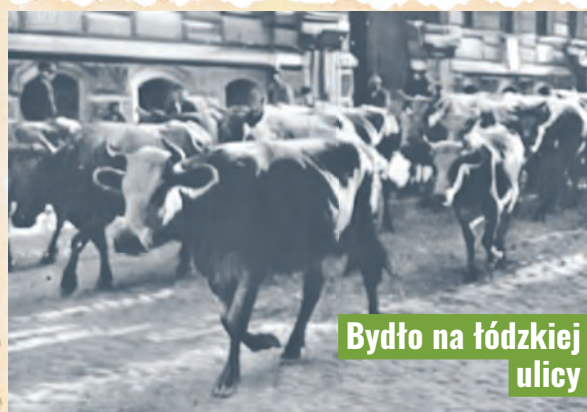
Bydło na łódzkiej ulicy

ścieli domów. Wprowadzono zakaz składowania na podwórkach śmieci, wylewania pomoy, nakazano również systematyczne oczyszczanie dołów kloacznych. Wywóz śmieci oraz zawartości szamb i dołów kloacznych mógł odbywać się tylko nocami, od godziny 24:00 do 7:00.