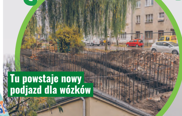
Tu powstaje nowy podjazd dla wózków

Trwa kompleksowy remont przychodni przy ul. Kasprzaka 27, aby łatwiej było korzystać z niej osobom z niepełnościami.