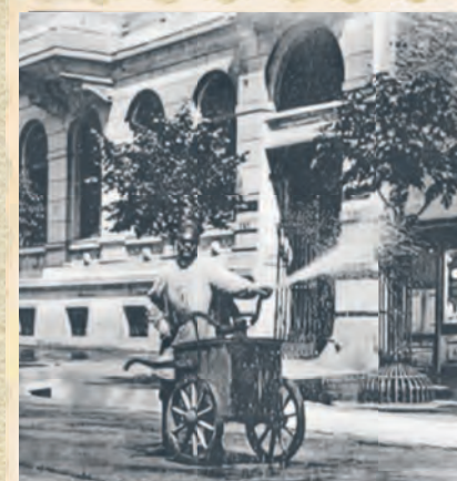
Do godziny 7 rano chodnik i ulica musiały być wysprzątane i polane wodą