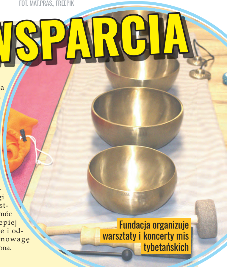
Fundacja organizuje warsztaty i koncerty mis tybetańskich