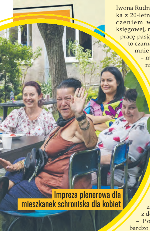
Impreza plenerowa dla mieszkanki schroniska dla kobiet