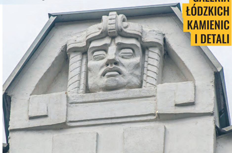
Zwieńczenie fasady kamienicy Hersza Gorelika przy ul. Próchnika 11, zbudowanej w 1909 r. z przeznaczeniem na trzypiętrowy hotel „Bristol”, wg projektu architekta Dawida Landego