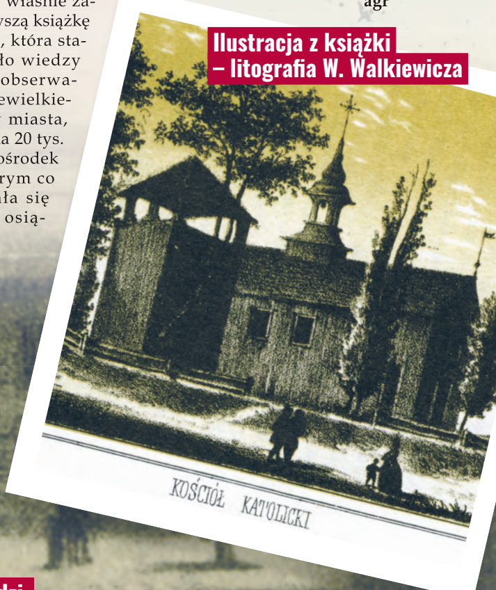
Ilustracja z książki – litografia W. Walkiewicza