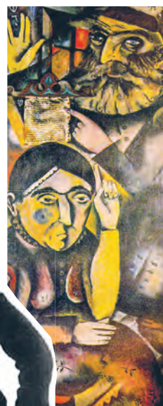
Jankiel Adler i jego obraz „Moi rodzice”

Sztuk Pięknych „Wystawie zimowej” zyskały duże uznanie. Wkrótce Jankiel został także członkiem łódzkiej grupy artystycznej „Jung Idysz”. W 1933 r. jego dzieła, głównie o tematyce żydowskiej, pojawiły się na międzynarodowej wystawie sztuki współczesnej w Nowym Jorku. W tym okresie je go o