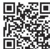
FOT. AMAT. PRAS.

Zgarnij bilety na koncert Śledź profil „Łódź.pl” na Facebooku. W środę i w czwartek ok. godz. 12:00 będzie można wygrać zaproszenia na dwa lipcowe koncerty.