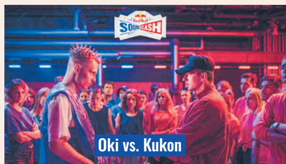
Oki vs. Kukon