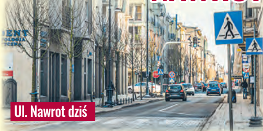
Ul. Nawrot dziś

jednokierunkowych traktów. Otóż ul. Przejazd (odwrotnie niż obecnie) prowadziła w kierunku wschodnim, do lasów rządowych, skąd zwożono drewno na miejskie budowy i na opał, a zaprzęgi wracały stamtąd do miasta po nawrocie, czyli właśnie ulicą Nawrot.