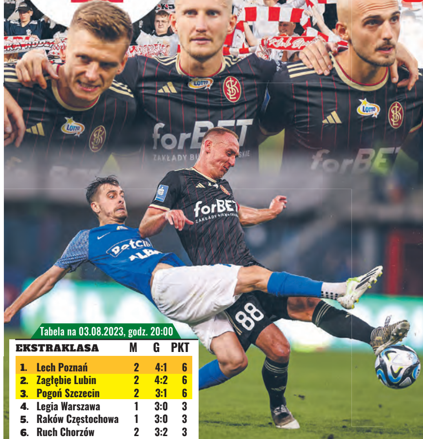
Tabela na 03.08.2023, godz. 20:00