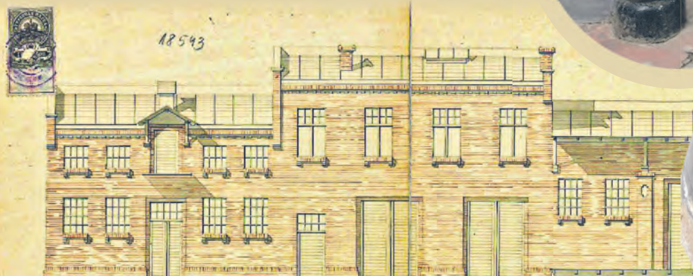
Projekt stajni i wozowni na posesji między Piotrkowską a Sienkiewicza