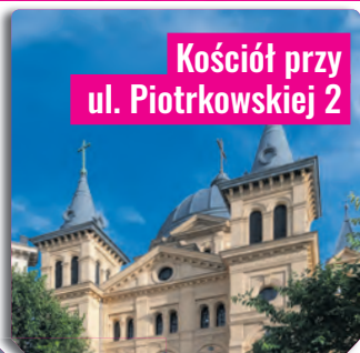
Kościół przy ul. Piotrkowskiej 2