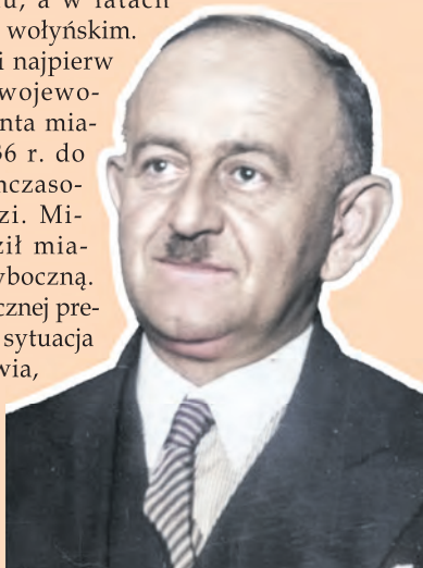
Mikołaj Godlewski, tymczasowy prezydent Łodzi w latach 1936–1939, mianowany przez władze rządowe