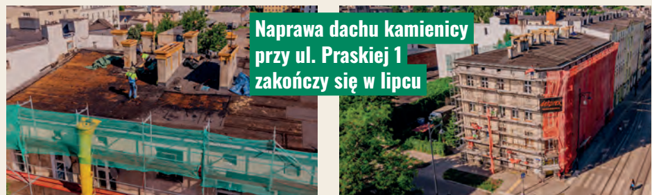
Naprawa dachu kamienicy przy ul. Praskiej 1 zakończy się w lipcu

żanej. Nowe dachy zyskały do tej pory m.in. budynki przy ulicach: Dąbrowskiego, Obywatelskiej, Złotno, Lumumby, Młynarskiej, Pabianickiej, Paryskiej i Tatrzańskiej. JT