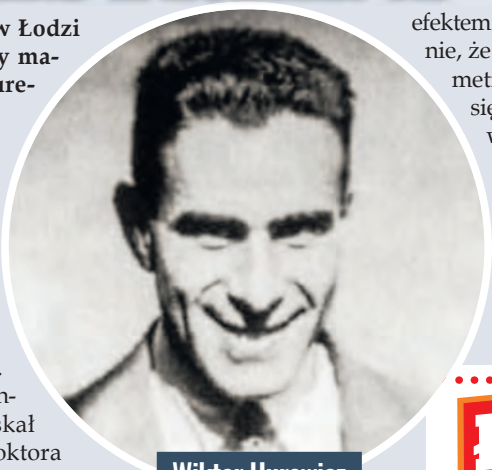
Witold Hurewicz – znany na świecie łódzki matematyk

Był synem łódzkiego przemysłowca. W 1921 r. zdał maturę w Łodzi i rozpoczął studia matematyczne na Uniwersytecie Wiedeńskim. Jego nauczycielami byli m.in. Hans Hahn i Karl Menger. Hurewicz uzyskał stopień naukowy doktora w 1926 r., w latach 1927–1928, dzięki fundacji Rockefellera, spędził rok w Amsterdamie. Następnie w latach 1928–1936 był asystentem sławnego naukowca Luitzena Brouwera. W 1936 r. wyjechał na rok do USA, do Princeton i podjął pracę w Uniwersytecie Karoliny Północnej. W czasie II wojny światowej pracował dla amerykańskiej armii nad zastosowaniami matematyki w MIT Radiation Laboratory. Głównym obszarem działalności naukowej Hurewicza była teoria wymiaru. Zajmował się topologią, czyli nauką o przestrzeni i teorią mnogo-