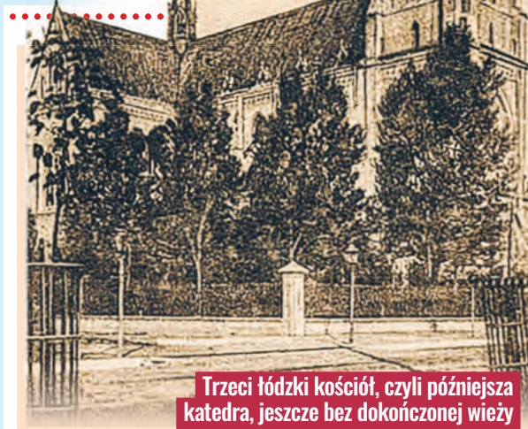
Trzeci łódzki kościół, czyli późniejsza katedra, jeszcze bez dokończonej wieży