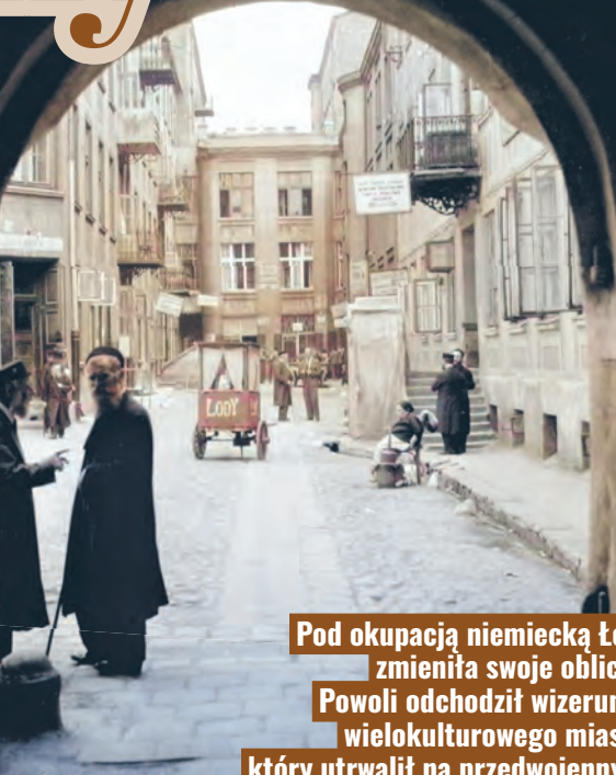
Pod okupacją niemiecką Łódź zmieniła swoje oblicze. Powoli odchodził wizerunek wielokulturowego miasta, który utrwalił na przedwojennych fotografiach Włodzimierz Pfeiffer

Już w pierwszych dniach okupacji niemieckiej rozpoczęła się dzika grabież. Zaraz po zajęciu Łodzi uzbrojone oddziały żołnierzy i policji zaczęły wkraczać do żydowskich mieszkań, warsztatów i sklepów. Pod pretekstem rewizji rabowano cenniejsze przedmioty, a grabieże kończyły się często pobicie właścicieli. Do rabunku aktywnie włączali się łódzcy Niemcy, którzy na własną rękę okradali bogatszych Żydów oraz zajmowali lepsze mieszkania i sklepy. Do akcji wkroczyły także grupy operacyjne SD, które po rozbiciu żydowskich związków i innych organizacji przejęły ich majątek. Rekwizycje i grabieże w Łodzi przybrały niespotykane rozmiary już na samym początku okupacji. W krótkim czasie niemal wszystkie przedsiębiorstwa żydowskie zostały wywłaszczone, a większość surowców wywieziono do Rzeszy. Utworzone w połowie listopada 1939 r. Łódzkie Towarzy-