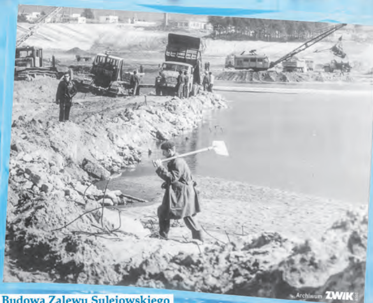
Budowa Zalewy Sulejowskiego

Projektowana bardzo duża wydajność sulejowskiego wodociągu (do 500 tys. m 3 wody na dobę) wymagała