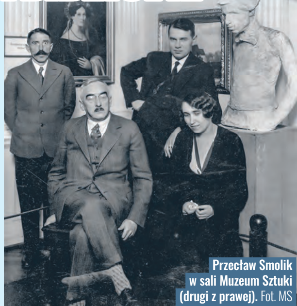
Przemysław Smolik w sali Muzeum Sztuki (drugi z prawej).

22 maja 1877 r. w Bochni urodził się Przemysław Smolik – lekarz, etnograf, literat, kolekcjoner sztuki azjatyckiej i ekslibrisów, a także wybitny bibliofil i znawca książki. Mieszkał w Krakowie (1895–1926), w Łodzi (1926–1935 i 1945–1947) i w Warszawie (1935–1945).