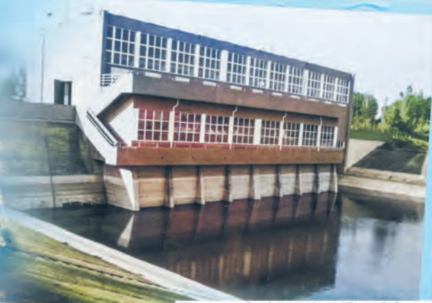
Dawne ujęcie wody w Bronisławowie