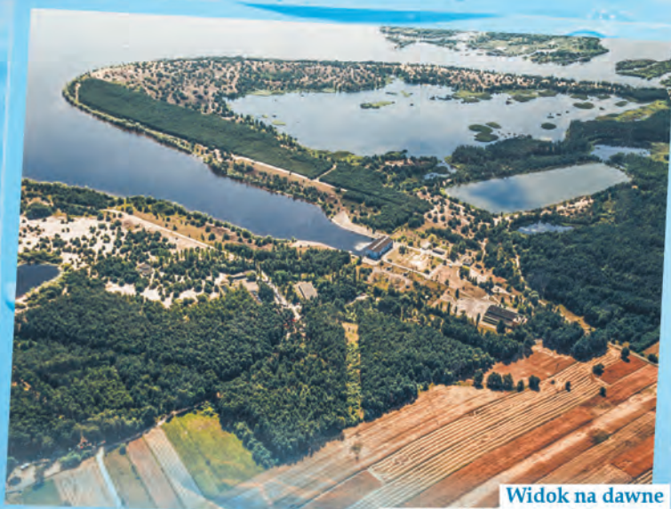
Widok na dawne ujęcie wody w Bronisławowie