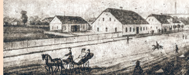
Zabudowania Steinertów przy ul. Piotrkowskiej w poł. XIX w.

Uprzemysłowienie ul. Piotrkowskiej postępowało w fragmencie leżącym w osadzie Łódka. Na odcinku od ul. Cegielnianej do ul. Czerwonej powstawały w podwórzach posesji małe farbiarnie, drukarnie i apretury.