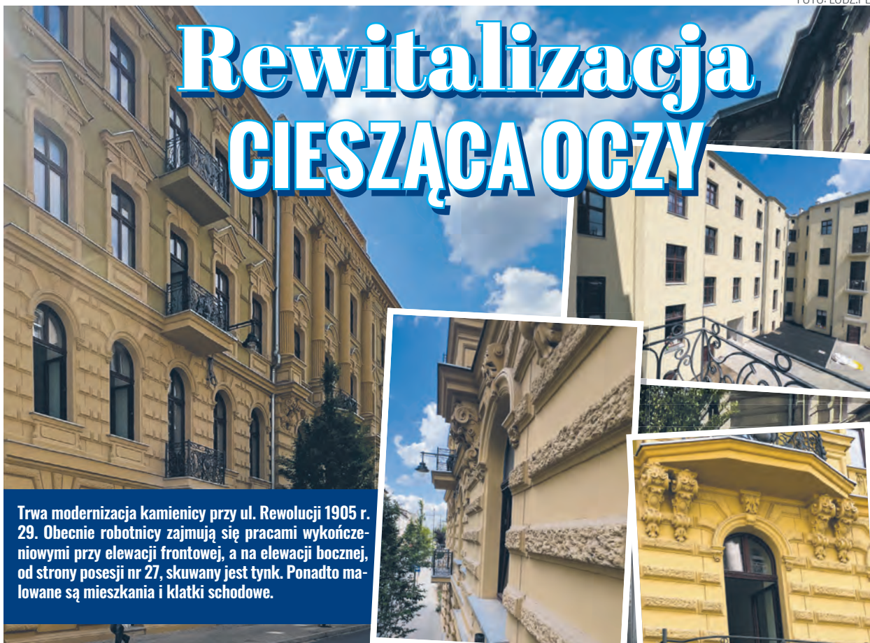
Trwa modernizacja kamienicy przy ul. Rewolucji 1905 r. 29. Obecnie robotnicy zajmują się pracami wykończeniowymi przy elewacji frontowej, a na elewacji bocznej, od strony posesji nr 27, skuwany jest tynk. Ponadto malowane są mieszkania i klatki schodowe.

Zakres aktualnych prac obejmuje również montaż osprzętu elektrycznego i teletechnicznego oraz rozdzielnic. W najbliższych dniach rozpoczną się roboty wykończeniowe i porządkowe. Wykonawca przystąpi również do stawiania ogrodzenia.