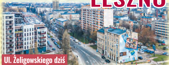
Ul. Żeligowskiego dziś

Kałuszyner mieszkał na co dzień przy ul. Piotrkowskiej 15, ale mieszkańcy i fabrykanci z okolic ul. Leszno wnieśli na niego skargę do magistratu i finalnie, po sądowym rozstrzygnięciu sporu, udroźniono przejazd drogą, której spory fragment przez jakiś czas był zamknięty, przegrodzony prywatną działką. agr