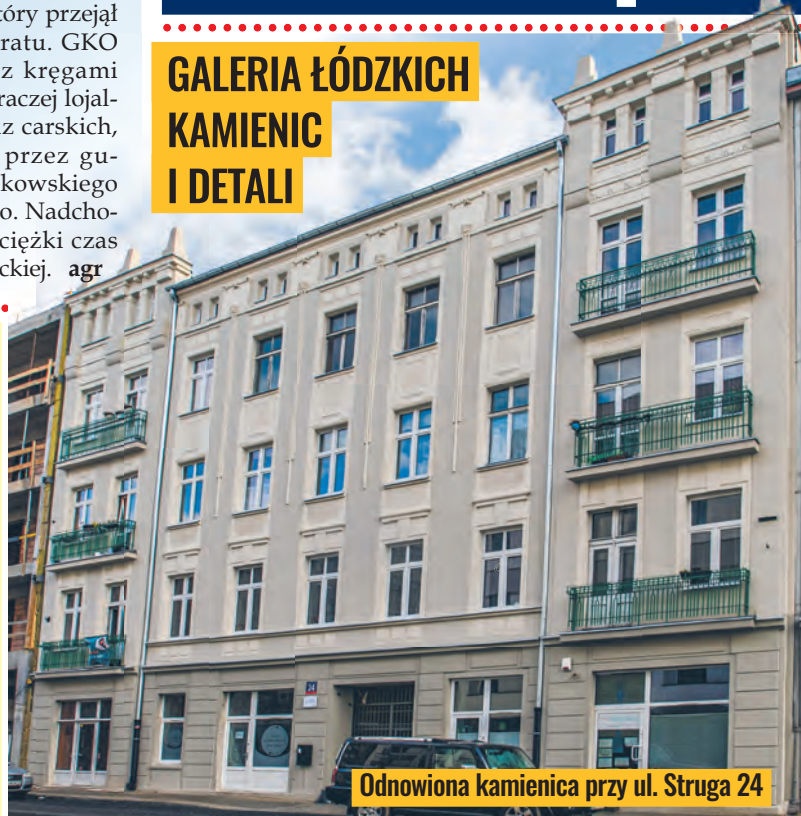
Odnowiona kamienica przy ul. Struga 24