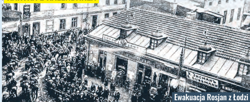
Ewakuacja Rosjan z Łodzi

31 lipca 1914 r. w parku Źródlika zorganizowano pierwszy punkt zborny dla rezerwistów w związku z wybuchem I wojny światowej. Do wojska rosyjskiego powołano w Łodzi ok. 15 tys. mężczyzn, a w następnych dniach tłumy rezerwistów błakały się po ulicach w poszu-