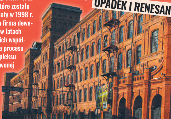
Budynek dawnej przedziałni – obecnie 4-gwiazdkowy hotel Andel's