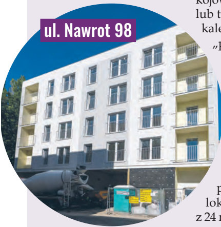
ul. Nawrot 98

Łódź, wspólnie z Widzewskim Towarzystwem Budownictwa Społecznego, buduje kolejne bloki. Część mieszkań trafia do puli komunalnej, część oferowana jest na zasadach TBS. To realna odpowiedź na potrzeby mieszkańców.