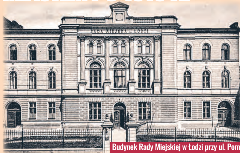
Budynek Rady Miejskiej w Łodzi przy ul. Pomorskiej 16 w pierwszych latach niepodległości