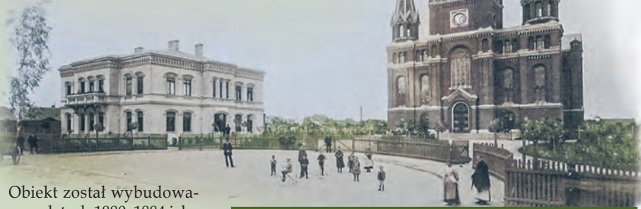
Kościół ewangelicki św. Jana na fotografii z pocz. XX w.

8 października 1884 r. biskup ewangelicki Paweł Ewert konsekrował kościół św. Jana przy ul. Dzikiej (dziś ul. Sienkiewicza 60).