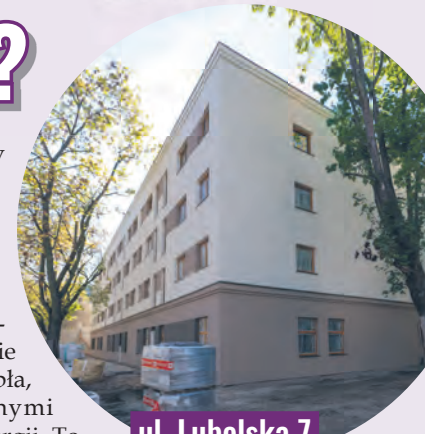
ul. Lubelska 7

cem zabaw. Przy ul. Skierniewickiej 8/10 zaplanowano 36 lokali w budynku niemal samowystarczalnym energetycznie – z pompami ciepła, panelami solarnymi i magazynem energii. To będzie przykład nowoczesnego, ekologicznego budownictwa, które obniży rachunki mieszkańców. Nowe lokale pojawią się także przy ul. Lubelskiej 7 (17 mieszkań), a duży blok – z 89 mieszkaniami – stanie przy skrzyżowaniu ulic Cegielińskiej i Ustronnej. Miasto czeka już na pozwolenie na budowę. W przygotowaniu jest