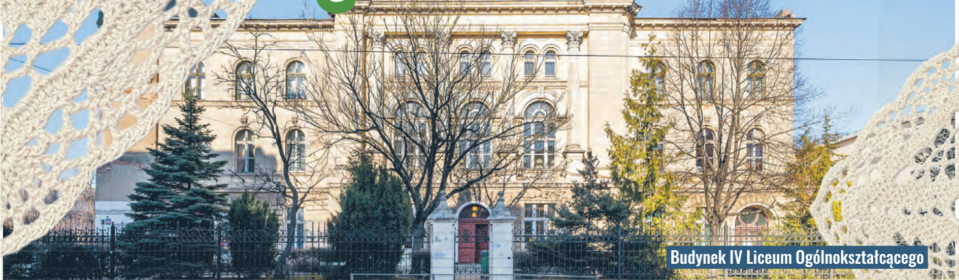
Budynek IV Liceum Ogólnokształcącego