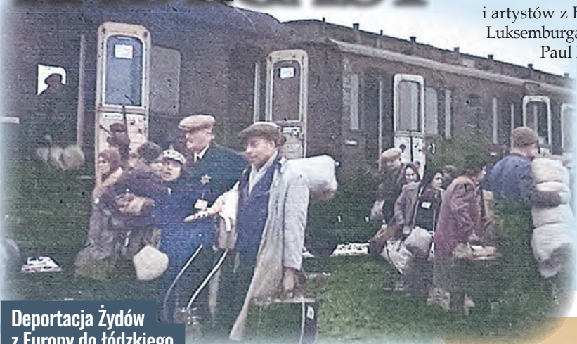
Deportacja Żydów z Europy do łódzkiego getta jesienią 1941 r.

ŁÓDŹ.pl DLA SENIORA | DLA RODZIN | DLA KOCHAJĄCYCH ŁÓDŹ