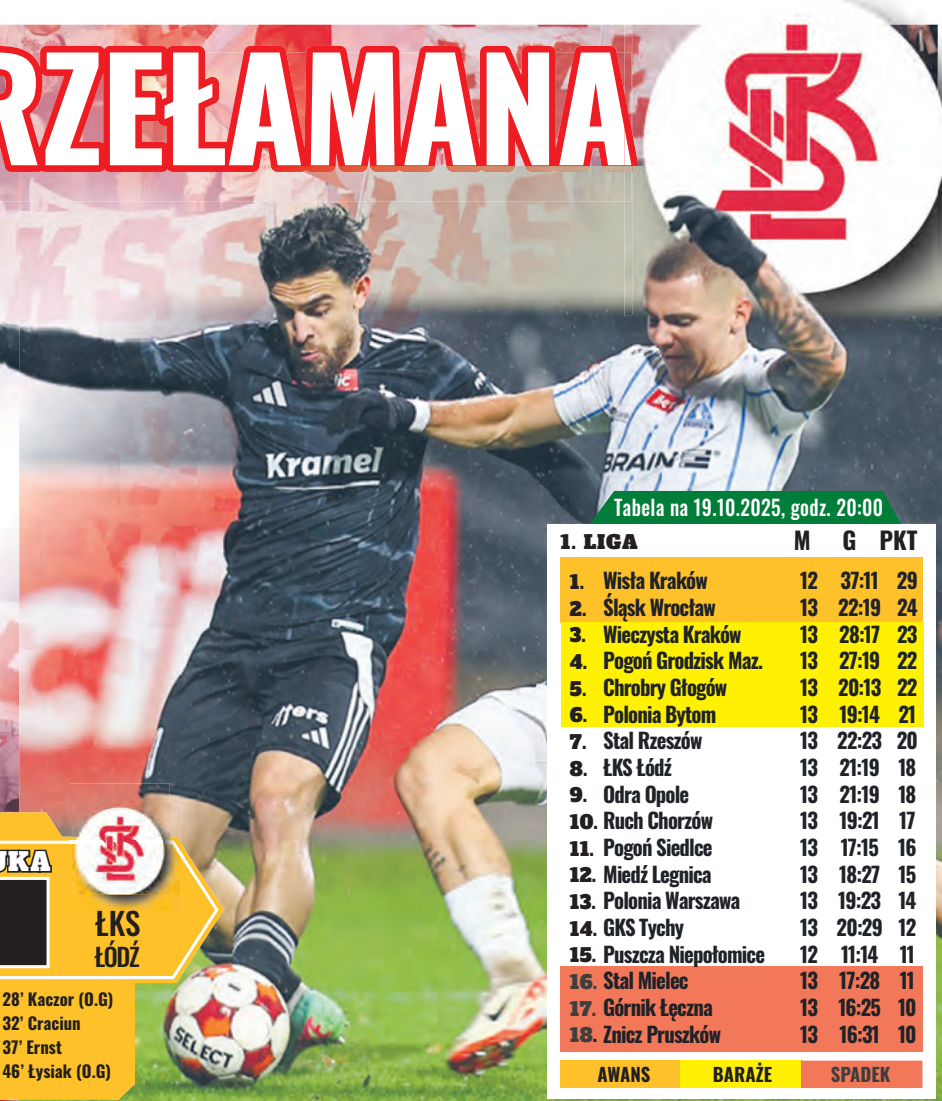
Tabela na 19.10.2025, godz. 20:00