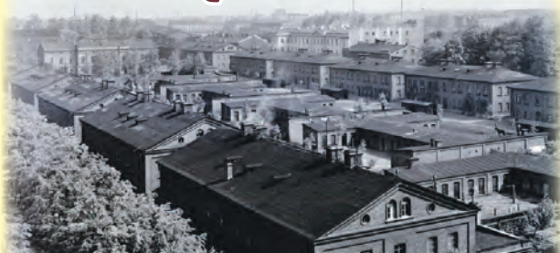
Nowoczesne na owe czasy osiedle robotniczych famu na Księżym Młynie na fotografii Włodzimierza Pfeiffera

Księży Młyn, w pełni funkcjonalne i unikatowe w skali Europy osiedle robotnicze, wybudowane w drugiej połowie XIX w. dla pracowników Karola Scheiblera, posiadało wiele udogodnień dla mieszkańców, m.in. szkołę, konsumy czy remizę strażacką. Torńplac to zwyczajowa nazwa jednego z nielicznych w Łodzi boisk sportowych dla dzieci i młodzieży, wyposażonych także w proste przyrządy gim-