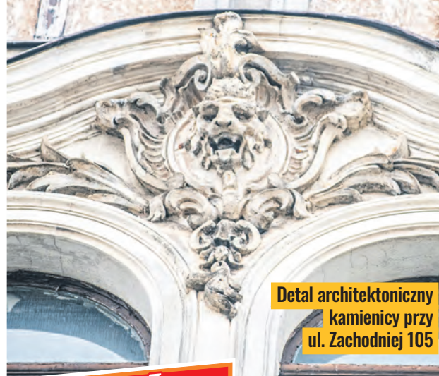
Detal architektoniczny kamienicy przy ul. Zachodniej 105