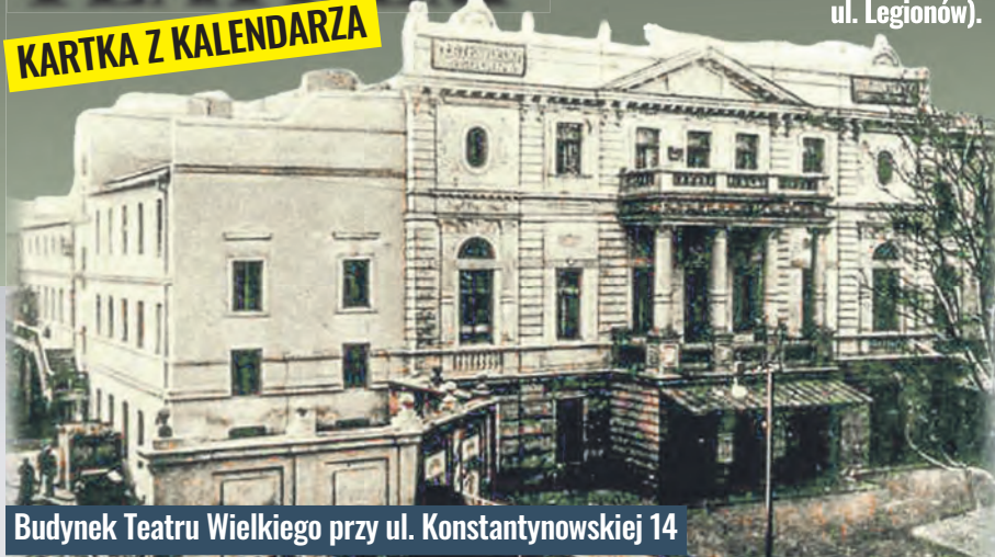
Budynek Teatru Wielkiego przy ul. Konstanyńowskiej 14