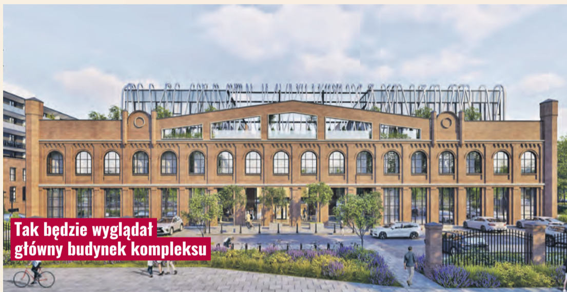
Tak będzie wyglądał główny budynek kompleksu

Już pięć lat trwa realizacja projektu kompleksu Widzewskiej Manufaktury WiMa, powstającego na bazie 140-letnich zabudowań po zakładach bawełnianych Kunitzera i Heinzla przy al. Piłsudskiego 135. Choć finał jest jeszcze odległy, prace idą pełną parą, a niektóre z zadań tej ambitnej inwestycji już zostały zakończone.