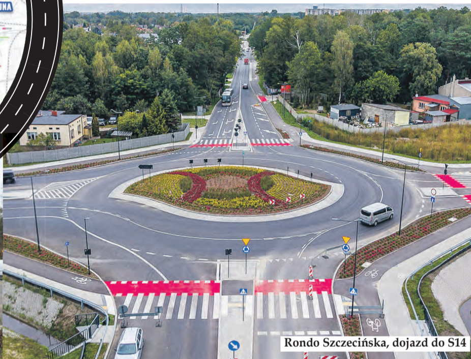
Rondo Szczecińska, dojazd do S14