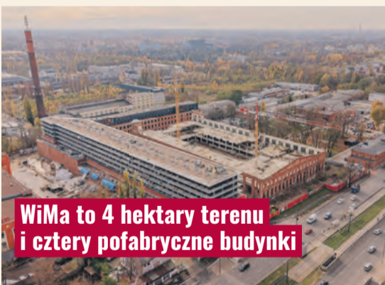
WiMa to 4 hektary terenu i cztery pofabryczne budynki