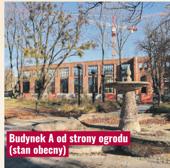
Budynek A od strony ogrodu (stan obecny)

od tego, co zapowiadano w momencie ogłoszenia projektu inwestycji WiMa. Pierwotnie inwestor planował zmienić obiekt w biurowiec, ale w obliczu kryzysu na rynku biurowym dawna przedalnia będzie budynkiem mieszkalnym. Od pierwowzoru ma się jednak niewiele różnić. Będzie to wysoki na pięć kondygnacji gmach na planie prostokąta z rozległym zielonym atrium pośrodku bryły oraz garażem zajmującym kondygnację podziemną i część parteru, na którym sąsiadować ma z lokalami usługowymi. Historyczne ściany zewnętrzne starej przed-