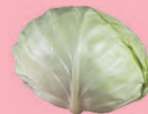
1 główka kapusty