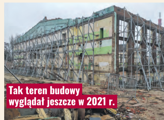
Tak teren budowy wyglądał jeszcze w 2021 r.