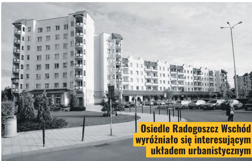
Osiedle Radogoszcz Wschód wyróżniało się interesującym układem urbanistycznym

Sztandarową inwestycją lat 80. XX w. była z pewnością budowa Instytutu Centrum Zdrowia Matki Polki przy ul. Rzgowskiej. To jedno z ważnych osiągnięć późnego okresu PRL-u, a jednocześnie swoisty gest w stronę miasta ciężko pracu-