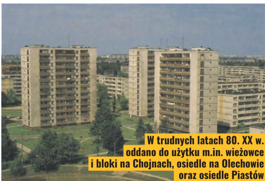
W trudnych latach 80. XX w. oddano do użytku m.in. wieżowce i bloki na Chojnach, osiedle na Olechowie oraz osiedle Piastów

jących w przemyśle kobiet. Przede wszystkim utworzono jeden z największych wyspecjalistycznych, wiodących ośrodków medycznych w Polsce w zakresie położnictwa i neonatologii, ginekologii oraz pediatrii. Kamień węgielny pod budowę wmurowano 21 października 1983 r. a Szpital Instytutu Cen-