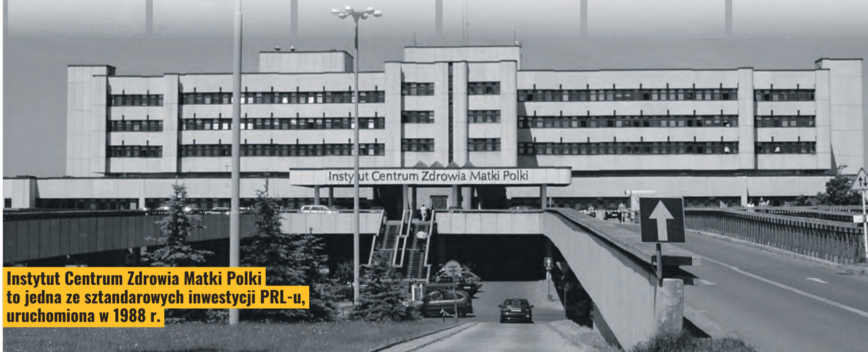
Instytut Centrum Zdrowia Matki Polki to jedna ze sztandarowych inwestycji PRL-u, uruchomiona w 1988 r.