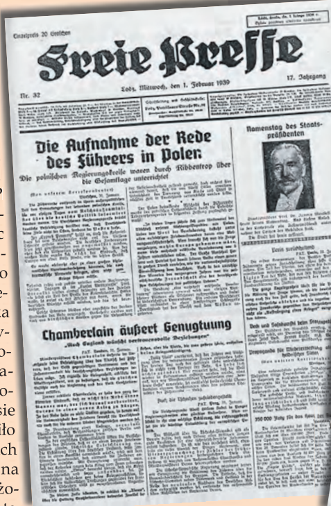
Tytułowa kolumna wydania „Freie Presse” oraz wycinki z dwóch głównych dzienników żydowskich wydawanych w Łodzi