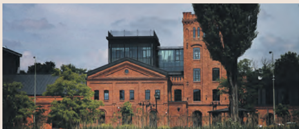
Na terenie dawnych zakładów Grohmana działa od 1997 r. Łódzka Specjalna Strefa Ekonomiczna