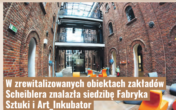
W zrewitalizowanych obiektach zakładów Scheiblera znalazła siedzibę Fabryka Sztuki i Art_Inkubator

Podobnie jak w przypadku Poltexu przez ostatnie dekady trwa proces rewitalizacji i zmiany funkcji postindustrialnych terenów. W starej przędzalni powstały lofty, zmodernizowano osiedle famuł na Księżym Młynie, a część obiektów po zakładach Grohmana objęła w 1997 r. Łódzka Specjalna Strefa Ekonomiczna. Proces re-