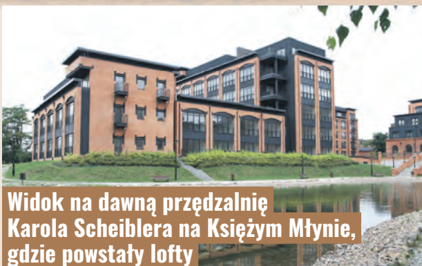
Widok na dawną przędzalnię Karola Scheiblera na Księżym Młynie, gdzie powstały lofty

Rozwój przemysłowej Łodzi wyznaczył w pierwszej połowie XIX wieku przerób wełny i bawełny. Po 150 latach – w latach 90. XX wieku – destrukcja włókienniczego miasta rozpoczęła się od likwidacji produkcji opartej na tych właśnie surowcach.