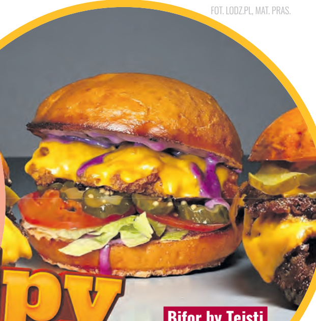
Bifor by Tejsti