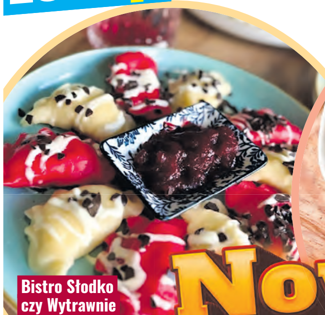
Bistro Słodko czy Wytrawnie