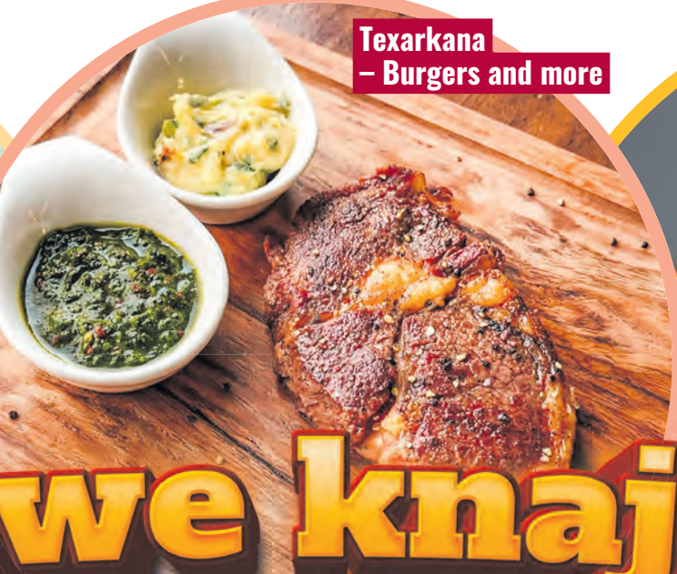
Texarkana - Burgers and more