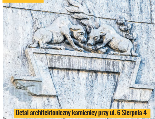
Detal architektoniczny kamienicy przy ul. 6 Sierpnia 4