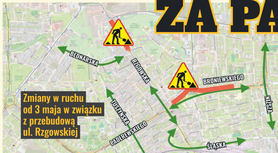
Zmiany w ruchu od 3 maja w związku z przebudową ul. Rzgowskiej

Po majówce rozpocznie się przebudowa ul. Rzgowskiej pomiędzy ulicami Dąbrowskiego i Paderewskiego. Remont podzielono na etapy, aby utrudnienia dla mieszkańców były jak najmniejsze – wciąż będzie można dojechać do sklepów, na rynek czy do przychodni.