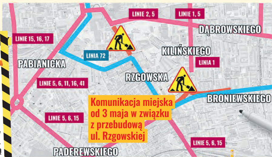
Komunikacja miejska od 3 maja w związku z przebudową ul. Rzgowskiej

Pojawią się też nowe miejsca parkingowe, o co martwili się mieszkańcy. Drogowcy skorygowali pod tym względem pierwotny projekt i dotożyli 40 miejsc parkingowych. Dzięki temu na całej ulicy będzie ich niemal 100!