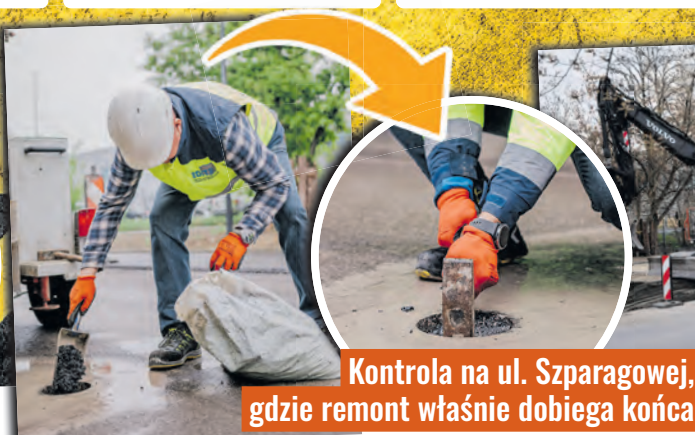
Kontrola na ul. Szparagowej, gdzie remont właśnie dobiega końca