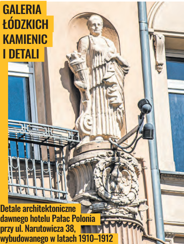
Detale architektoniczne dawnego hotelu Pałac Polonia przy ul. Narutowicza 38, wybudowanego w latach 1910–1912