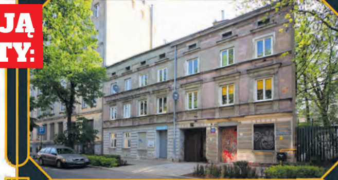
Ul. Gdańska 108