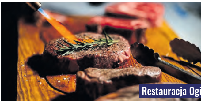
Restauracja Ogień i Sól