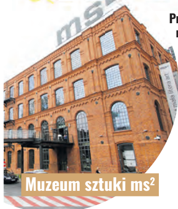
Muzeum sztuki msz 2

Po dziewięciu dniach spędzonych w Łodzi mogę śmiało powiedzieć, że to jedno z moich ulubionych miast na świecie – napisała dziennikarka