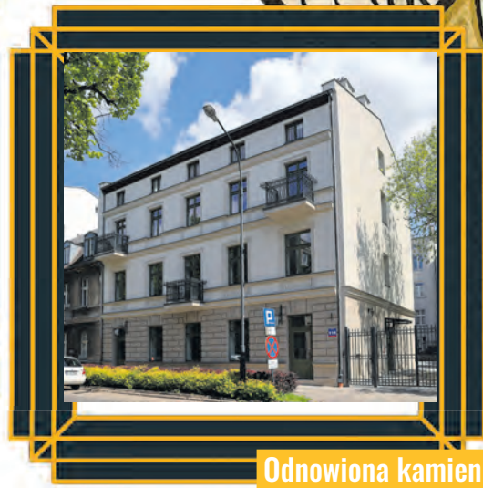
Odnowiona kamienica przy ul. Gdańskiej 114

Okolice ul. Gdańskiej, Zamenhofska i Kopernika zmieniają się w oczach. Miasto wyremontowało tu najpierw kamienice, potem ulice, a teraz przyszedł czas na kolejne gruntowne odnowy kamienic. Swoje dokładają też prywatni inwestorzy, którzy upatrzili sobie ul. Gdańską na południe od ul. Zamenhofska.