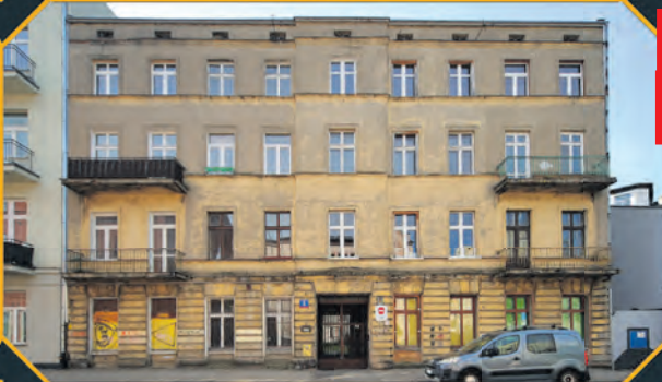
Ul. Kopernika 6