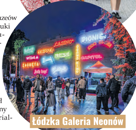
Łódzka Galeria Neonów