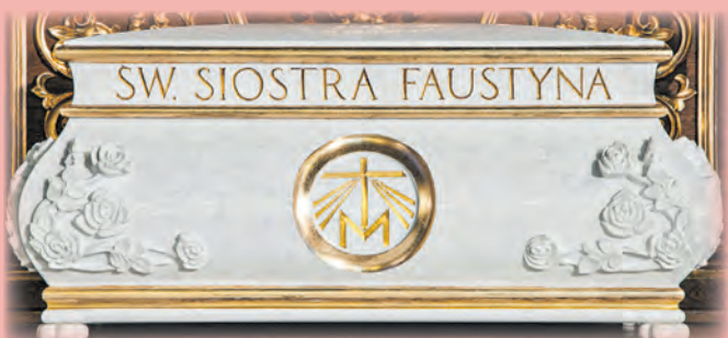
Trumna z relikwiami św. Faustyny w Krakowie-Łagiewnikach