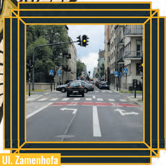
Ul. Zamenhofska po remoncie