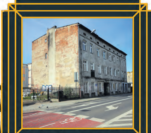
Ul. Zamenhofska 26