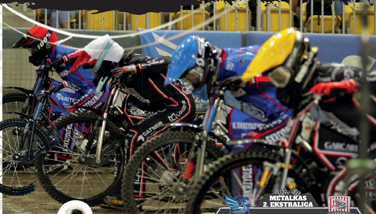
(7 czerwca) meczu Orła przeczytasz na stronie