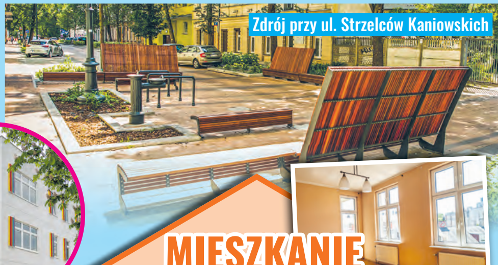
Źródło przy ul. Strzelców Kaniowskich