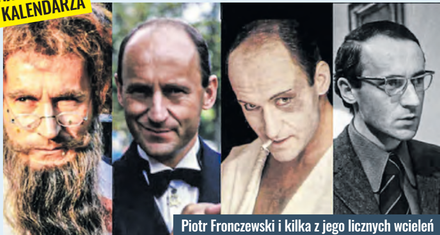
Piotr Fronczewski i kilka z jego licznych wcieleń

8 czerwca 1946 r. w Łodzi urodził się Piotr Fronczewski – aktor teatralny, filmowy, kabaretowy i dubbingowy, piosenkarz, reżyser i pedagog.