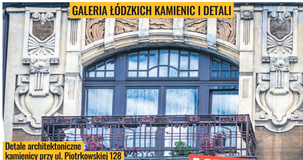
Detale architektoniczne kamienicy przy ul. Piotrkowskiej 128