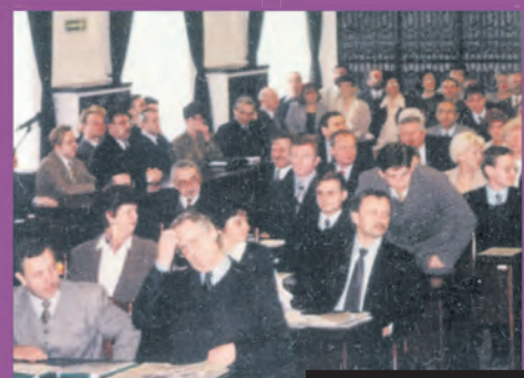
Rada Miejska w Łodzi III kadencji