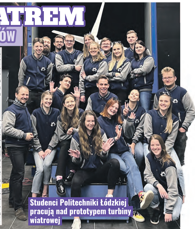
Studenci Politechniki Łódzkiej pracują nad prototypem turbiny wiatrowej