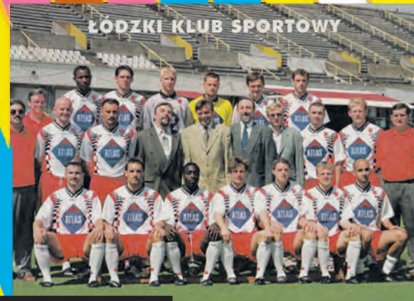
Plakaty honorujące piłkarskie mistrzostwo Polski Widzewa i ŁKS-u

Na marginesie trudności gospodarczych i życia politycznego w Łodzi w II połowie lat 90. XX w. kibice mieli powody do dumy. Łódzcy piłkarze przez trzy lata dzierżyli tytuł Mistrza Polski – dwukrotnie, w latach 1996 i 1997, zdobył go RTS Widzew pod wodzą Franciszka Smudy i raz, w 1998 r., najlepszą drużyną futbolową w kraju został ŁKS. Radość była wielka.