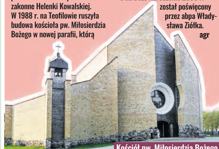
Kościół pw. Miłosierdzia Bożego przy ul. Baczyńskiego na Teofilowie

został poświęcony przez abpa Władysława Ziółka. agr